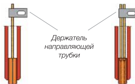
Сварка одной проволокой

Максимальный диаметр проволоки 3,2 мм. Направляющие трубки длиной 358 мм подходят для контактной трубки длиной 275 мм. Направляющие трубки можно обрезать до необходимого размера.