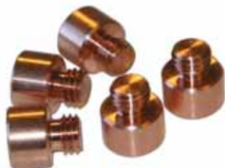
Комплектуется 12-тью губками